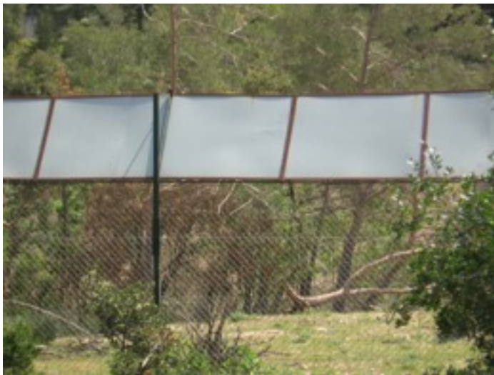
Clôture de plus de 3m.au zoo de Montpellier

prendra beaucoup de précautions pour la respecter. L'exemple du paint-ball voisin laisse malheureusement présager un massacre. Nous invitons les teyrannais, qui ne l'auraient pas fait, à donner un coup d'oeil aux dégâts que peut causer une aire de loisir dans cette zone : il suffit de longer le paint-ball par le chemin du semi-marathon, à mi-pente sur la colline entre Teyran et Castries (voir photo).