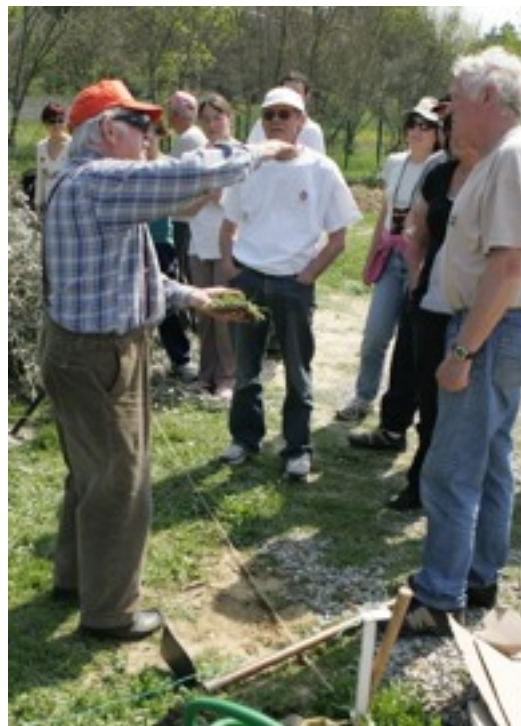
Les jardins partagés de Teyran

Sorties botaniques et sorties champignons.