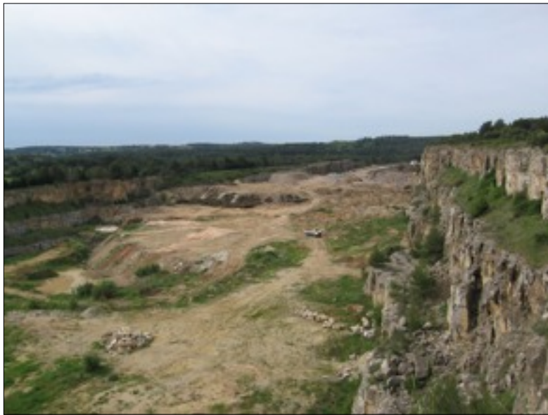
Le camion donne l'échelle.

C'est jouer sur les mots que d'affirmer que l'ancienne carrière sera « comblée ». Le fameux « comblement », qui n'est rappelons le qu'un dépôt de déchets, dure depuis près de 10 ans et doit continuer 10 ans de plus. Lorsqu'on observe le trou depuis la partie haute (voir photo prise ces jours ci), il devient évident qu'il ne sera que très partiellement comblé à échéance. La hauteur prévisible de comblement par les déchets n'est qu'au tiers de la plus basse falaise en moyenne ; probablement seul un palier sur le centre de sa partie est atteindra le haut de cette falaise. A la fin du dit « comblement » il subsistera un énorme trou bordé de falaises abruptes.