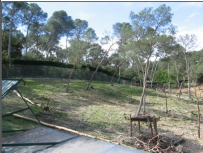
Enclos des singes magot au zoo de Montpellier

b- Les singes magots vont non seulement détruire le sous-bois mais, comme cela s'est produit dans des parcs analogues, ils risquent de s'attaquer aussi aux grands arbres.