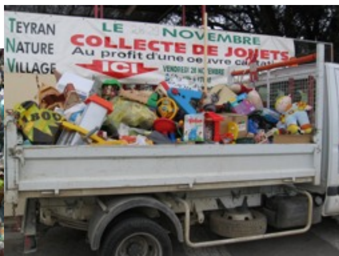
Ramassage de jouets