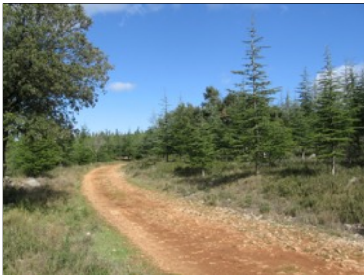
Boisement de la partie est de la ceinture verte de Teyran

Un des arguments entendu pour justifier la création du parc de singes à cet endroit : « personne ne rentre dans les sous-bois, les promeneurs restent sur les chemins ». Or l'une des richesses de ce secteur est précisément la densité et la difficile accessibilité de ses sous-bois.