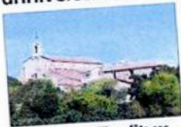
■ Teyran Nature Village fête ses 30 ans au service du village

Programme : 9h: départ de la salle des fêtes pour une visite du sentier botanique qui se terminera à 11h. Sous les pins à l'entrée du sentier, rétrospective des actions de TNV suivie d'un apéritif. Enfin, pour ceux qui le souhaitent, repas tiré du sac. 14h30: conférence ô mon beau roud-point par une ethnobotaniste et départ d'un jeu de piste dans Teyran pour les enfants de 6 à 11 ans, organisé par l'association Passe Muraille (sur inscriptions). 18h: