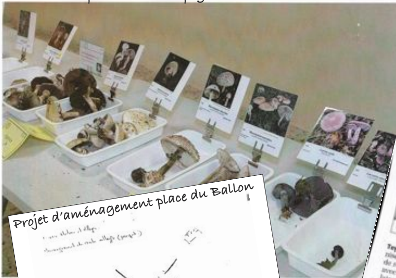
Projet d'aménagement place du Ballon